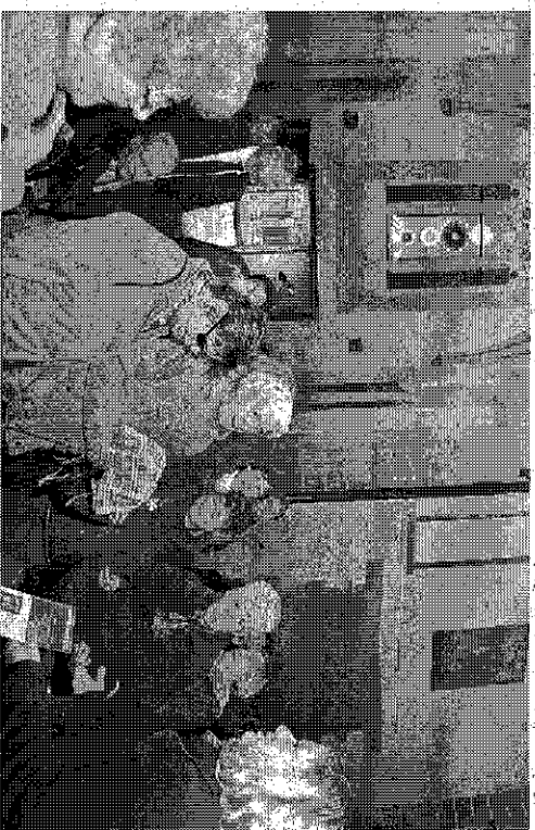
Démonstration dans l'église de la Halle aux bleds en présence aussi du conseil intercommunal des jeunes.

En France, on dénombre plus de trois millions de personnes atteintes de déficience visuelle. Ce chiffre, qui regroupe 5% de la population hexagonale, devrait augmenter dans les années à venir, du fait du vieillissement de la population. Or, malgré la loi du 11 février 2005 et la création en 2000 du label national "Tourisme et handicap", l'accueil des publics en situation de handicap visuel demeure encore insuffisant, déplore "Braille et culture", dont l'action est de sensibiliser les acteurs des filières tourisme et culture. Pour cela, l'association créée en 1990 à Aiguperse,